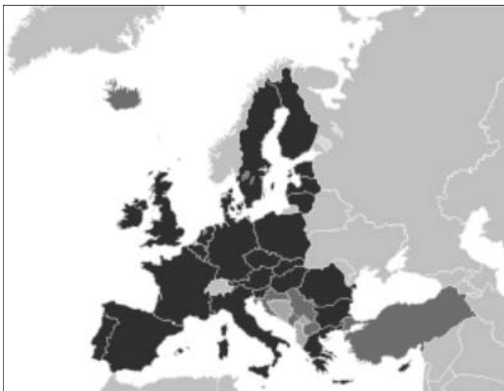
Slika 1. Karta Evropske unije koju čine 27 zemalja članica 11

Zbog svega navedenog Evropska unija i diplomatija Evropske unije predstavljaju uzor regionalne diplomatije koji bi trebalo da posluži kao pozitivan primer drugim zemljama da se svi problemi i međusobne nesuglasice mogu rešiti razumom, kompromisom, ukoliko postoji