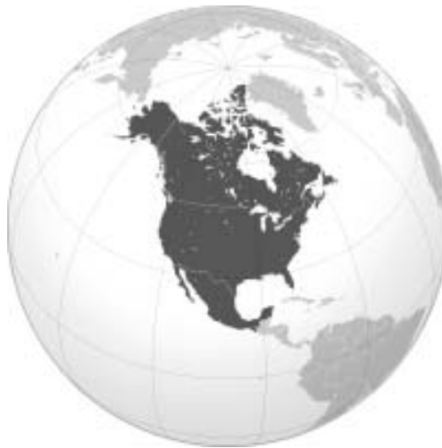
Slika 2. Zemlje članice NAFTA (SAD, Kanada i Meksiko) 12

Neoliberalistički koncept slobodne trgovine između ostalog navodi i da slobodno kretanje robe, usluga i kapitala omogućava veće ljudske slobode, jer daje pravo čoveku na izbor. Antiglobalistički pokret ima totalno suprotne stavove i upravo iste te argumente navodi kao proces ukidanja osnovnih ljudskih sloboda, i globalnu vladavinu kapitala imenuje globalnim vladarem koji upravlja ljudskim životima.