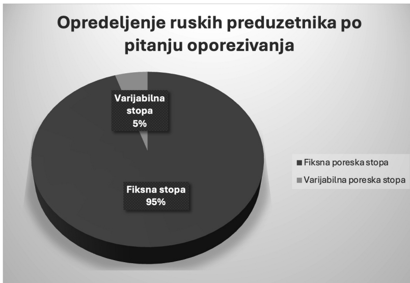
Grafikon 6: Opredeljenje ruskih preduzetnika po pitanju oporezivanja