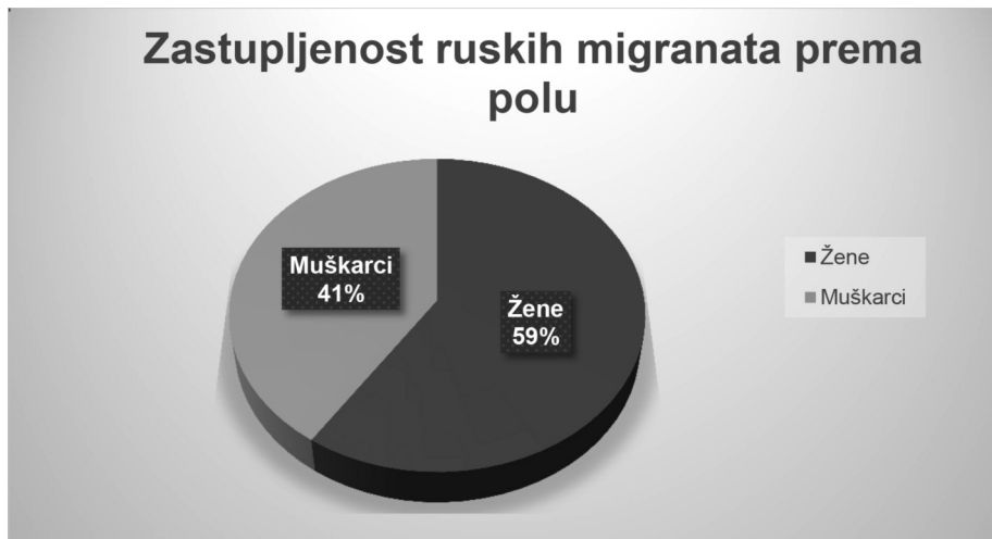
Grafikon 3: Zastupljenost ruskih migranata prema polu