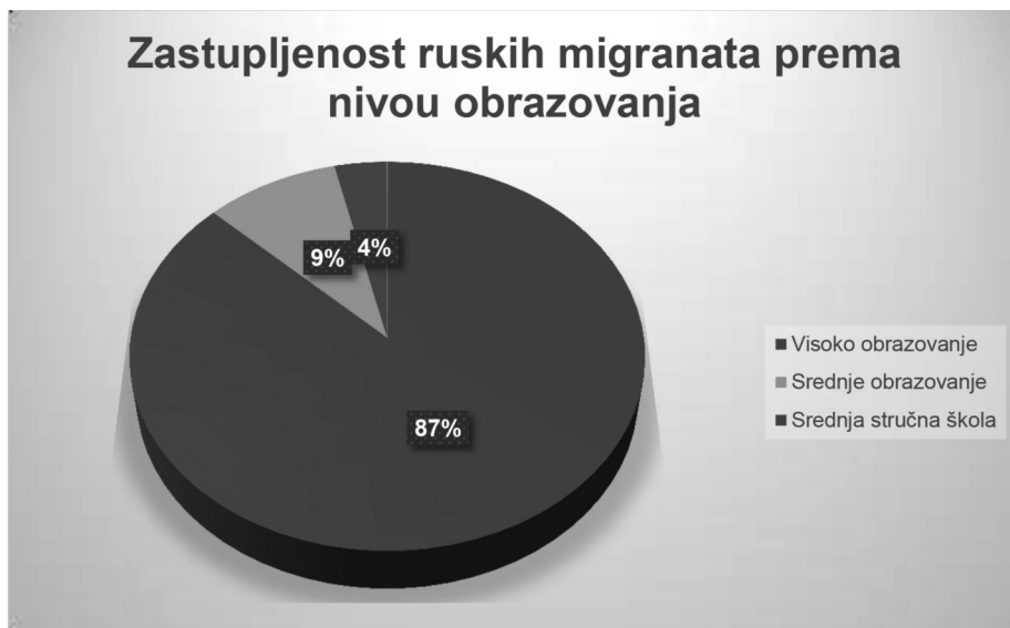
Grafikon 4: Zastupljenost ruskih migranata prema nivou obrazovanja