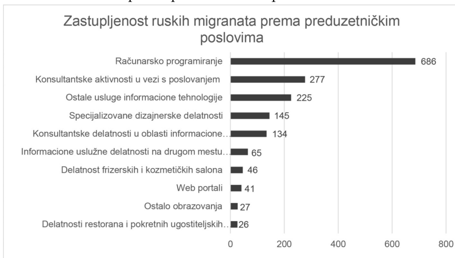
Grafikon broj 5: Zastupljenost ruskih migranata prema preduzetničkim poslovima